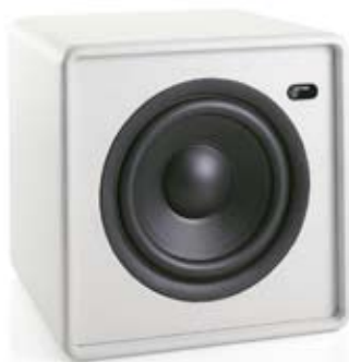
Framsida / Front