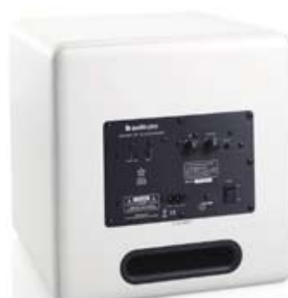
Baksida / Rear

House Code väljare Volym Zon väljare Justera delningsfrekvens manuellt Justera basvolym manuellt Basreflexport